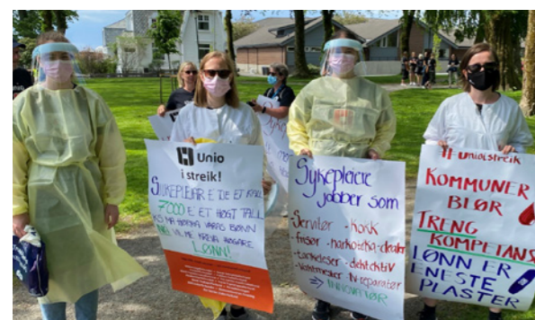
Medlemmer gikk i streiketog i Haugesund sentrum under streiken

Det ble søkt om, og innvilget, mange dispensasjoner under streiken i KS. Derfor ble det satt opp dukker som sto streikevakt for uunnværlige sykepleiere