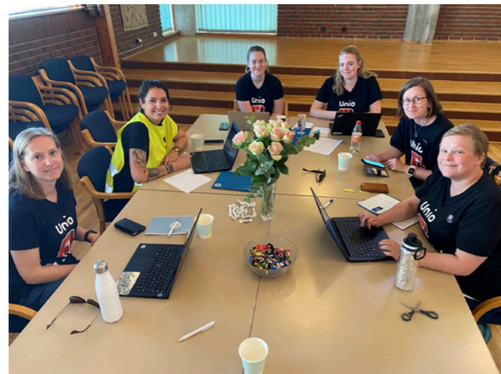
Dispensasjonskomiteen i Unio Haugesund kommune

MEDLEMMER OG TILLITSVALGTE i Stavanger og Haugesund kommune var i streik til det ble innført tvungenlønnsnemnd av arbeids- og inkluderingsminister Torbjørn Røe Isaksen. Fra 4. juni var også streiken en faktum i sykehusene, som er under tariffområde Spekter. I Rogaland er det ingen medlemmer som er tatt ut i streik, men vi støtter og heier på Unio-kolleger som nå tar kampen for alle. I forbindelse med streikene er det kommet inn mange bilder, både fra markeringer og som støtteklæringer. NSF Lokalen deler noen av disse bildene i en kavalkade her.