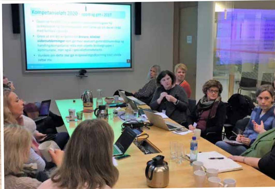
Engasjerte deltakere i gode diskusjoner under besøket i helsedirektoratet.